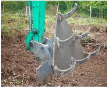
Pioche à herser (technique 3B)