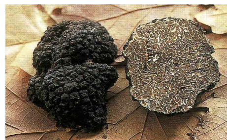
Truffe de Bourgogne

Elle est vendue dans notre région sous l'appellation « truffe de Lorraine » ou « truffe de Bourgogne ».