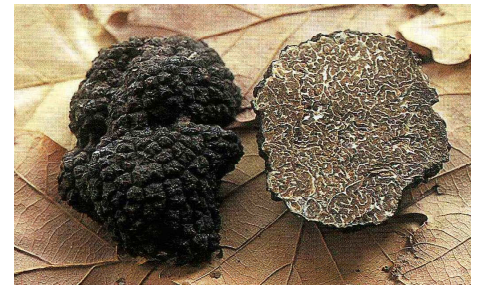
Truffe de Bourgogne

Elle est vendue dans notre région sous l'appellation « truffe de Lorraine » ou « truffe de Bourgogne ».